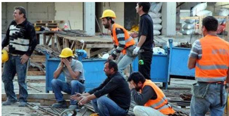
Cuando solo queda llorar por el compañero muerto

En agosto de 2019 pusimos en marcha esta nueva sección con carácter semanal y con vistas a propagar en prensa local y nacional la pandemia de muertes por siniestros laborales que sufrimos en España.