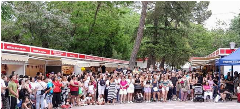
Feria Intercultural de Guadalajara 2025.

El parque de La Concordia se ha llenado en la mañana de este sábado soleado de color, música, acentos y sabores del mundo con la inauguración de la IV Feria Intercultural de Guadalajara , «un evento que celebra la riqueza cultural de la ciudad y promueve la convivencia, el respeto y la inclusión», según han informado fuentes municipales en un comunicado..