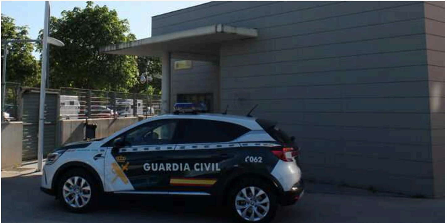
Fachada del cuartel de la Guardia Civil de Azuqueca