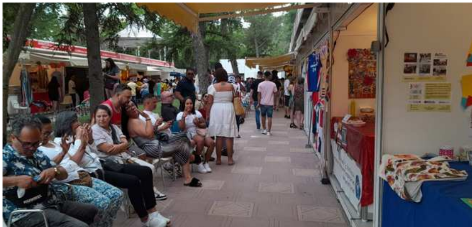
Feria Intercultural de Guadalajara 2025.

La feria, que se celebra durante todo el fin de semana, ha comenzado con una intensa programación que ha llenado el parque de vida desde primera hora.