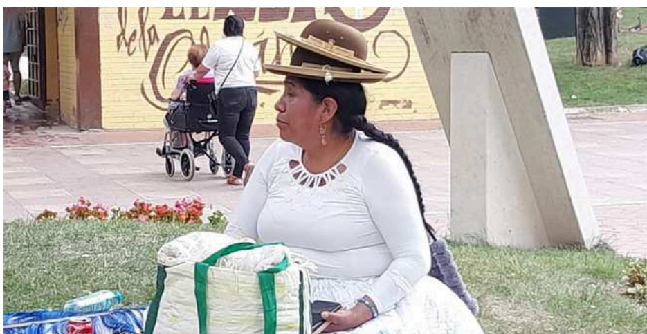
Feria Intercultural de Guadalajara 2025.

La feria continuará mañana, domingo 1 de junio , con una nueva jornada repleta de actividades para todos los públicos. Desde las 11:00 hasta las 20:00 horas, los stands volverán a abrir sus puertas y el escenario central acogerá nuevas actuaciones musicales y de danza.