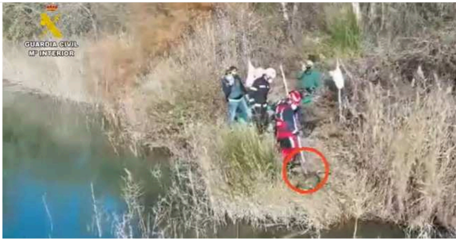
Imagen del rescate del cadáver del perro del interior de la laguna.