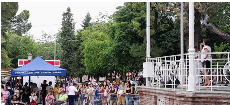
Feria Intercultural de Guadalajara 2025.

También de distintos espectáculos en el templete central, con música en directo, danzas folclóricas , desfiles de moda y exhibiciones artísticas que han hecho vibrar al público y varios talleres participativos, como costura tradicional, lengua quechua , narrativa infantil y redes sociales, que han fomentado el aprendizaje y el intercambio cultural, así como charlas informativas.