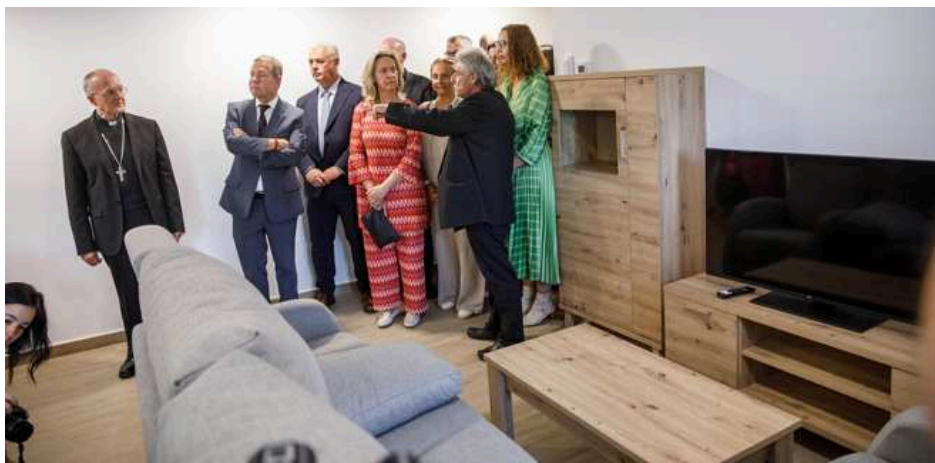
Imagen de Esteban González. JCCM

Este centro se encuentra ubicado en las instalaciones del antiguo albergue Betania , en la avenida de Venezuela de la capital alcarreña, y cuenta con seis viviendas independientes y capacidad para 35 personas , según han informado fuentes municipales en un comunicado.