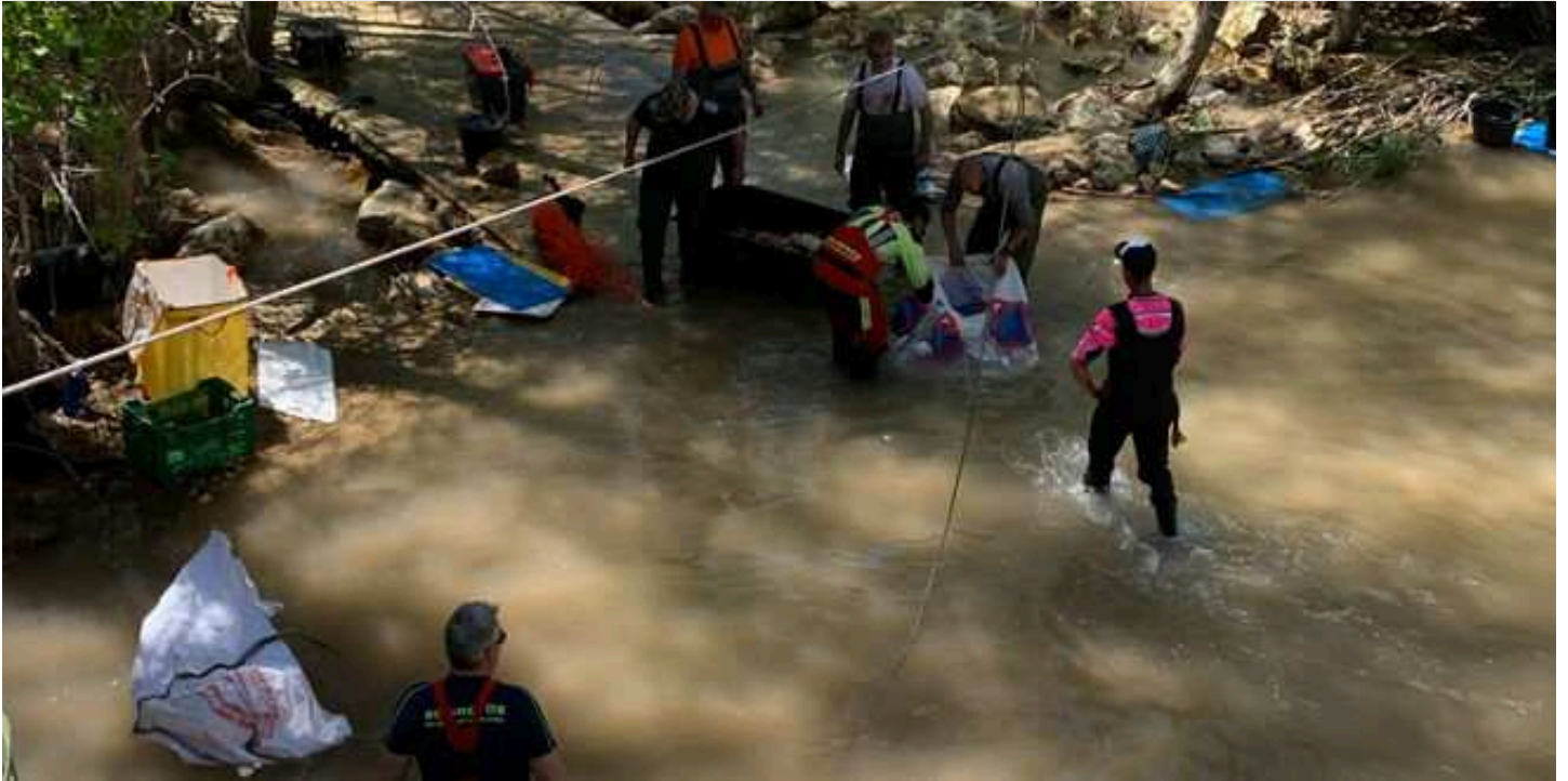
Imagen de la Confederación Hidrográfica del Tajo