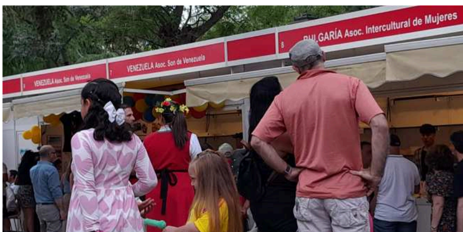
Feria Intercultural de Guadalajara 2025.

Este sábado, los visitantes han podido disfrutar de estands culturales y gastronómicos de más de una veintena de países y colectivos, como Italia, Venezuela, Colombia, Ecuador, México, República Dominicana, Bulgaria, Ucrania, Perú y el Pueblo Gitano, con productos típicos, artesanía y trajes tradicionales.