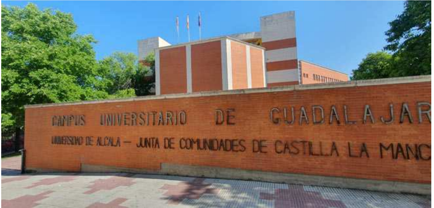
Campus de la Universidad de Alcalá, UAH, en Guadalajara