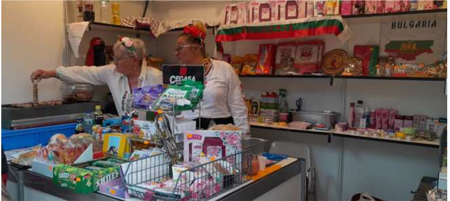
Feria Intercultural de Guadalajara 2025.