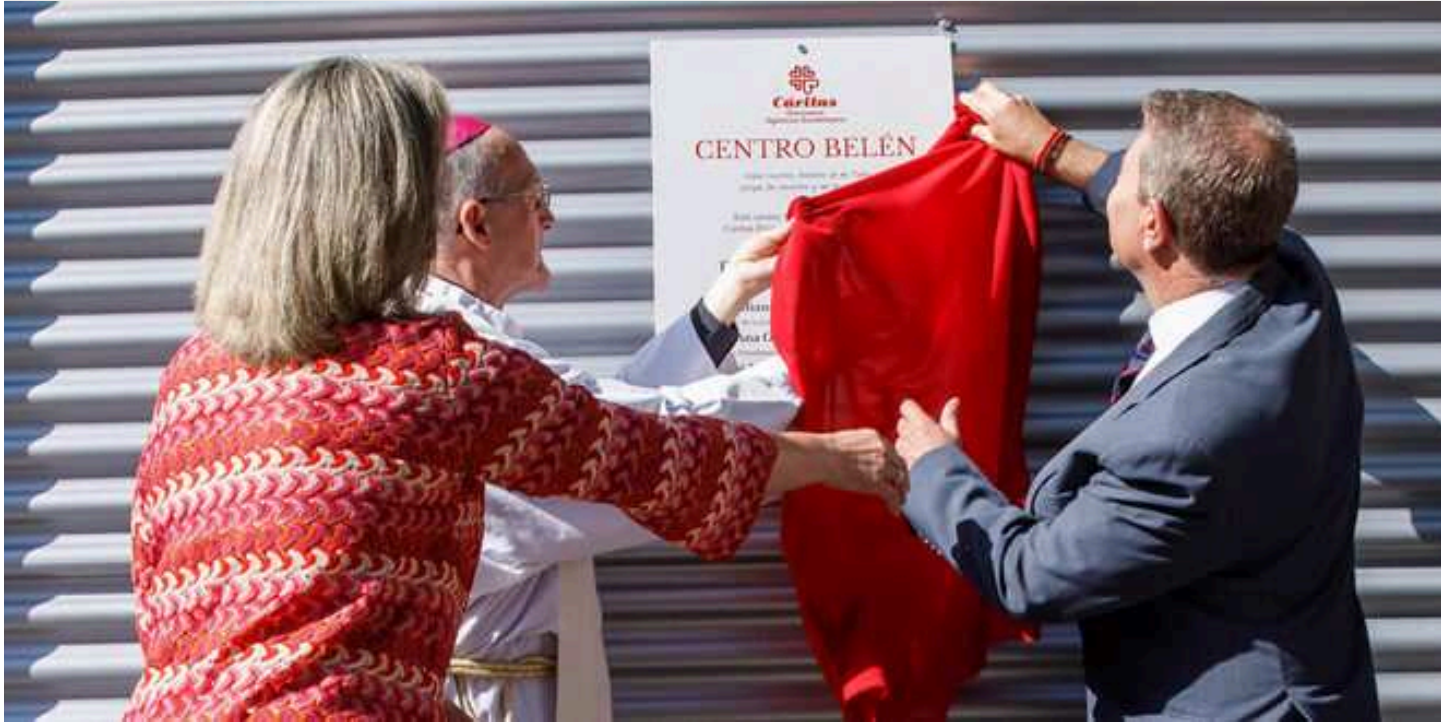
Descubrimiento de la placa conmemorativa.