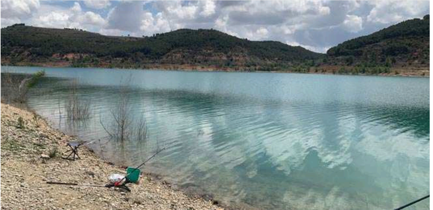
Embalse de Buendía (Cuenca)