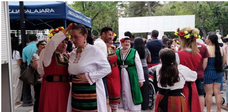
Feria Intercultural de Guadalajara 2025.

La feria, que se celebra durante todo el fin de semana, ha comenzado con una intensa programación que ha llenado el parque de vida desde primera hora.