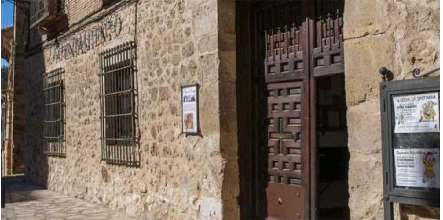
Fachada del edificio del Ayuntamiento de Pastrana